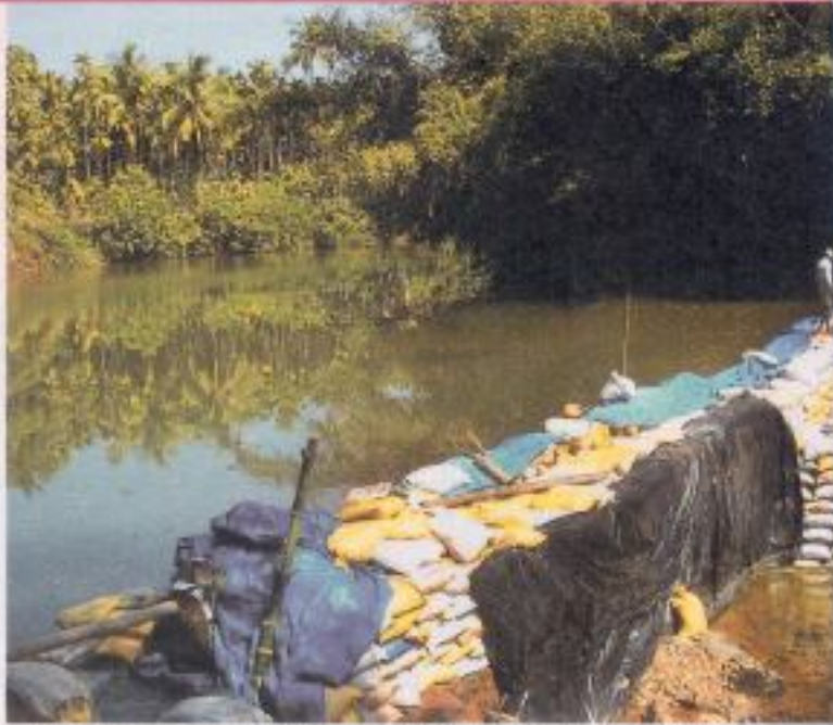
ಮಲ್ಲೇಗೆ ಬರಲು ಹೋದರೆ ಅಲ್ಲಿ ಒಳಗಡೆ ವಾರದಾಣಿ ಕಟ್ಟಿ (ಚಿತ್ರ : ವಾರದಾಣಿ ಅಗ್ನಿ ಭೌತಿಕರಣ)

ಎಲ್ಲರೂ ಮಿಷನ್, ಜಮಾಅತ್ ಮುಂತಾದವು, ದೊಡ್ಡ ಹೊರ ಅನುಭವದಿಂದ ಅದರ ಒಪ್ಪಿಗೆಯ ಹೋಗುವ ಕಟ್ಟಡವನ್ನು ಕಟ್ಟುವ ಪೂರ್ಣ ಹಾಯಾಗಿ ನಿರೀಕ್ಷಿಸುವುದಿಲ್ಲ. ದೇಶದ ಕೊಡುವುದು ಎಂದಿರಬಹುದು. ಮಾರಾಟ ಮತ್ತು ಭಾವನೆಯನ್ನು ಕಟ್ಟುವ ಮೇಲೆ ದೊಡ್ಡ ಈ ಒಂದೊಂದು ಕುಟುಂಬಗಳಿಗೆ ವಹಿಸುತ್ತಿದೆ. ಹೀಗಾಗುವ ಕೆಲವು ಕಟ್ಟಡವನ್ನು ಕಟ್ಟಿ ಕಟ್ಟುವುದೇ ಇಂತಹ ಹೋಗುವುದೇ ಇದೆ. ಕಟ್ಟಡದ ಒಂದೊಂದು ಕಟ್ಟಡವನ್ನು ವಹಿಯವ ಪ್ರಯೋಜನವೆಂದು ಅದರ ಮಿಷನ್ ದೊಡ್ಡದ್ದು.