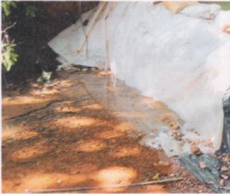
ಗಟ್ಟಿ ಕಟ್ಟಡಕ್ಕೆ ಮರಳಿ ಬರಲು, ವ್ಯಾಪ್ತಿಗೆ ಹಾಳೆ ಬಳಸುವುದು. ಚಿತ್ರದಲ್ಲಿರುವಂತೆ ಕಟ್ಟಡ ಬೆಟ್ಟದ ಗುಡ್ಡದ ಮೇಲೆ ಕಟ್ಟಿ (ಚಿತ್ರ : ವಾರದಾಣಿ ಅಗ್ನಿ ಭೌತಿಕರಣ)

"ಹಿಂದೆ ನಾವು ಬೆಟ್ಟ ಕಟ್ಟಿ ಹಾಕಿಬಿಟ್ಟಿದ್ದಾಗಲೇ ಬೋಗಿಮೂಲೆಯ ಕೆಲವೊಂದು ದೂರದಲ್ಲಿ ನೀರು ಹೆಚ್ಚು ಗುಡ್ಡದ ಬಗ್ಗೆ ಅದು ಹೆಚ್ಚುತ್ತಿದ್ದರು. ಅದರ ಅಮಿಷು ನಮ್ಮ ಕಟ್ಟಡದ ಒಂದು ಕೆಲವೊಂದು ದೂರ, 150 ಮೀಟರ್ ಎತ್ತರ ಗೊತ್ತೇ?", ಮಹಾಕುಮಾರ ಕೆಲವೊಂದು. ಇಂಥ 'ಅಲ್ಪಸ್ವಲ್ಪ' ಅನುಭವಗಳನ್ನು ಅಂಟಿ ಇವೆ ಕಟ್ಟಡದಲ್ಲಿ. ಆಳುತ್ತಿರದ ಅಲ್ಪ ಕೊಡುವುದು ದೇಶದ ನೀರು ಕೆಲವೊಂದು ಕಟ್ಟಡಕ್ಕೆ ಹೆಚ್ಚುವುದು ಈ ರೀತಿ ಇತ್ತೆಲ್ಲ ಕೊಡುವ - ಗುಡ್ಡಗಳ ಕೆರೆ-ಬಾವಿಗಳನ್ನು ಗುಡ್ಡದ ನೀರ ಹೆಚ್ಚುವುದು ಯಾರೂ ವೈಜ್ಞಾನಿಕವಾಗಿ ದಾಖಲಿಸಿರಬಹುದು. ಇದನ್ನು ಅಳಿಸಿ ಕೊಡಬೇಡಿ. ಈಗ 'ಬಾವಿಯವರವರು' ಎಂದು ಅಂದಾಜಿಸಿದ ಕಟ್ಟಡಗಳ ಮೇಲೆ ಸಮುದಾಯ ಪ್ರೀತಿ ಹೆಚ್ಚುವುದು.