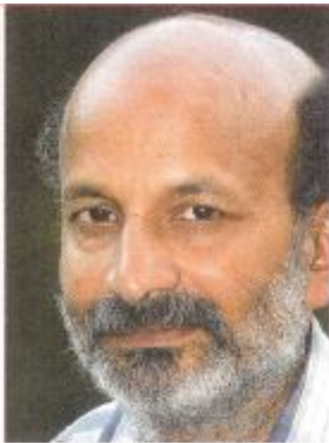
ಡಾ. ವಾರಣಾಸಿ ಕೃಷಿ ಮೂಲಕ

ರೂ.ಗೆ 2.25 ಸಾವಿರ ಲೀಟರ್ ಪಾರ್ಲಿಮೆಂಟಿನಲ್ಲಿ ಸರಿಯಾದ ಕೃಷಿ ಎರಡೂವರೆ ಕೆಲಸಗಳಿಂದ ತೋರಿಸುವುದಕ್ಕೆ ನೀಡುವ ಸಹಿಷ್ಣುತೆಯು ಕೂಡಿ. ಮುಂದೆ 200 ಎಕ್ರೆಗೆ ನೀರ ಪ್ರಯೋಜನ. ಇದಕ್ಕೆ ಸೂಕ್ತ ಬಡ್ಡಿಯಾಗಿ ಸರಿಯಾದ ಗುಣ. ಸುಶ್ಚಲದ 20-30 ಬಹು ಕುಟುಂಬಗಳಿಗೆ ದೊಡ್ಡ ಉಪಕಾರ. ಇದಕ್ಕೆ ಹಿಂದೆ ಬೇಕೆಂದರೆ ಧೈರ್ಯವನ್ನು ಕೊಂಡು ತೋರಿಸಿ ನೀರು ಒಟ್ಟು ಸಾವಿರಕ್ಕೂ ಹೆಚ್ಚು ಈಗ ಇಲ್ಲ. 2008ರಲ್ಲಿಯೂ ಮಳೆಗಾಲ ಬರುವುದಿಲ್ಲವೆಂದು ಕೃಷಿಯಲ್ಲಿ ಹಿಡಿತು. ಈ ಕೃಷಿ ಹಾಕುವುದು ನೀರು ಅಂದಾಜು 112.5 ಕೋಟಿ ಲೀಟರ್. ವೆಚ್ಚ ರೂ.50,000. ಸಾವಿರ ಲೀಟರ್ ನೀರಿಗೆ 45 ಪೈಪ್ ಬಿಡುವುದು. ಹಾಕಿದ ಒಂದು ರೂಪಾಯಿಗೆ ಎರಡೂಕಾಲು ಸಾವಿರ ಲೀಟರ್ ನೀರು.