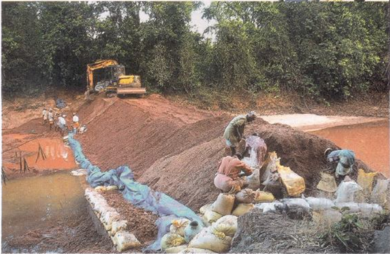
ಹಿಟಾಟಿ ಬಳಸಿ ಬರೀ ಮರಳು ಕಟ್ಟಿ ರಚನೆ