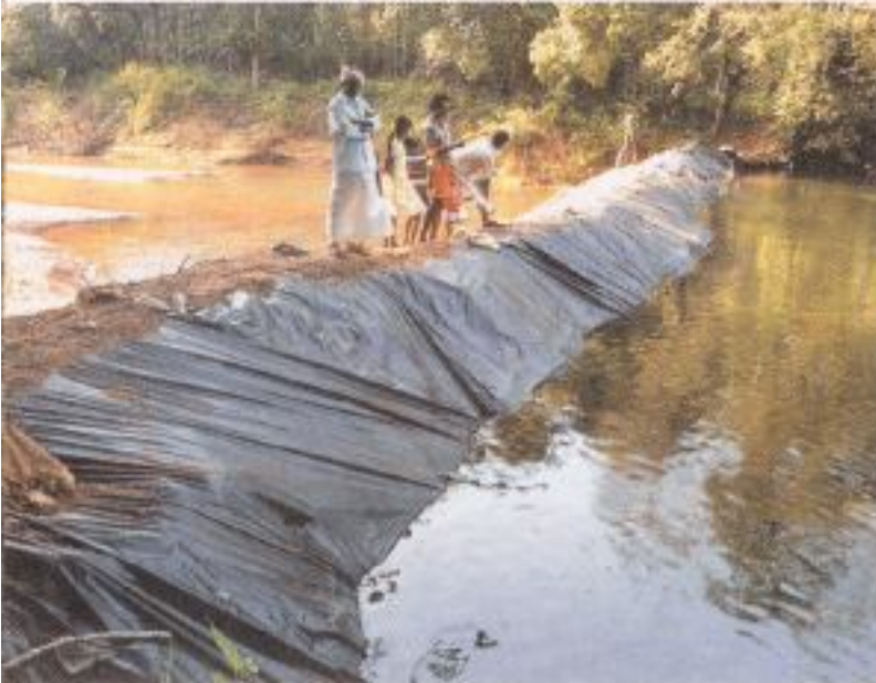
ಬೀದಿ ಮೇಲೆ, ಮೇಲಿನಿಂದ ಹಾಕಿದ ಕಟ್ಟಿಗಳ ಮೇಲೆ ಮೇಲೆ ಕಟ್ಟಿ.

ಇತ್ತೀಚಿನ ತೋಟಗಾರಿಕೆ ನಿರೀಕ್ಷೆಗಳಿಗೆ ನಿರೀಕ್ಷೆ, ಅದಿಲ್ಲದಿದ್ದರೆ (ಅಂದಾಜು) ತೋಟಗಾರಿಕೆ - ಕಟ್ಟಿಗಳ ಮೇಲೆ ಇರುವ ಪ್ರಯೋಜನ. ಅದರ ಧಾರಣೆ ಕಾಣಿಸಲು ಇದ್ದೇ ಇಲ್ಲ. ಹಳ್ಳದ ಹರಿವಿನ ಮೇಲೆ, ಮೇಲೆ ಮತ್ತು ಕೆಳಗಡೆಗೆ ನೀರ ಮಟ್ಟ