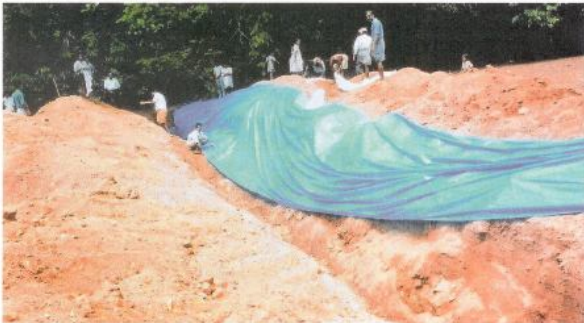
ಬದೇ ದಾರ್ ಕೃಷ್ಣದ ಕೂಡಾ. ಕೆಲಸಗಾರರಿಂದ ಮೂರೂರಿ ಪ್ರಾಸ್ತಕ್ ಹಾಲೆ ಕೊಡುಮೆಟ್ಟಿಲುದ ಬದೇ ಕೃಷ್ಣದ ಕಾಲ.